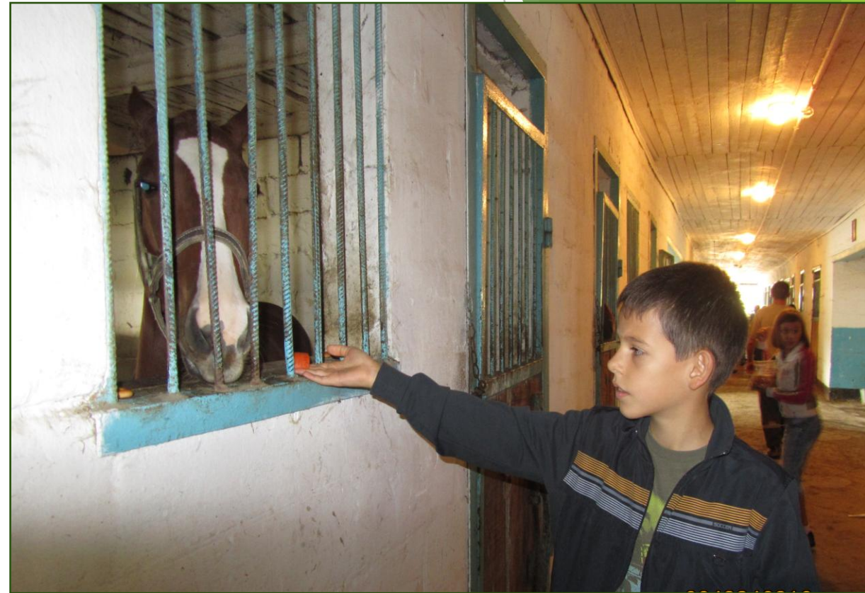
Экскурсия на сельскохозяйственную ферму