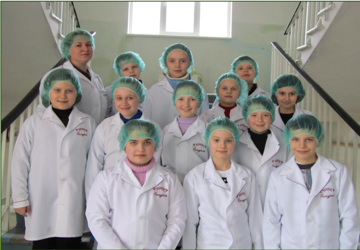
Посещение кондитерской фабрики