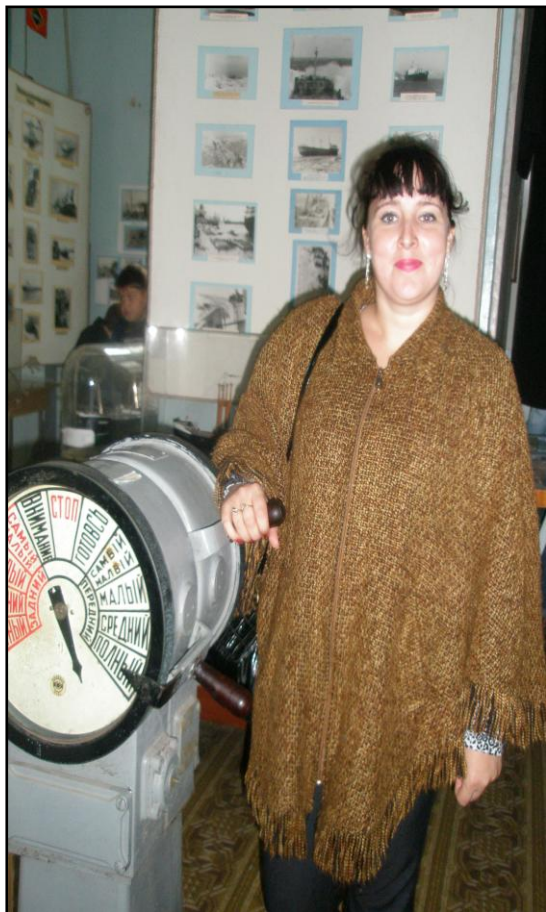
Посещение учебных заведений города