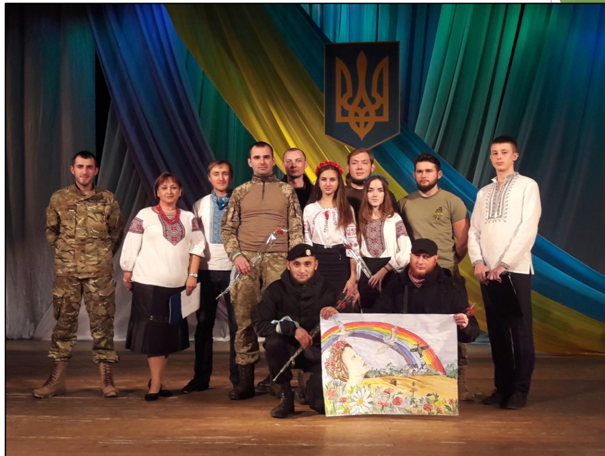
Встреча с защитниками Украины